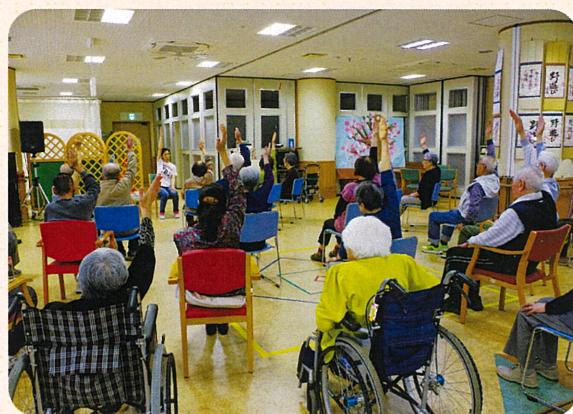
「体操」（通所介護）いつまでも元気でいられるように楽しく運動をしていただけるようお手伝いします