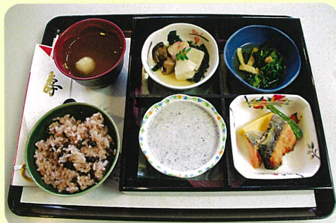
「食事」(共通)おいしく楽しく食事を召し上がっていただけるよう工夫しています

原則65才以上の方が対象の介護保険適用の入所施設です。食事、入浴、レクリエーション、機能訓練等のサービスを提供いたします。