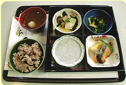
「食事」(共通)おいしく楽しく食事を召し上がっていただけるよう工夫しています

原則65才以上の方が対象の介護保険適用の入所施設です。食事、入浴、レクリエーション、機能訓練等のサービスを提供いたします。