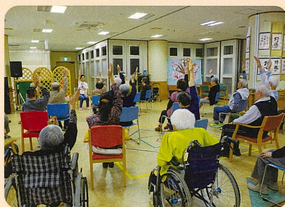
「体操」（通所介護）いつまでも元気でいられるように楽しく運動をしていただけるようお手伝いします