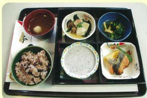
「食事」(共通)おいしく楽しく食事を召し上がっていただけるよう工夫しています

原則65才以上の方が対象の介護保険適用の入所施設です。食事、入浴、レクリエーション、機能訓練等のサービスを提供いたします。