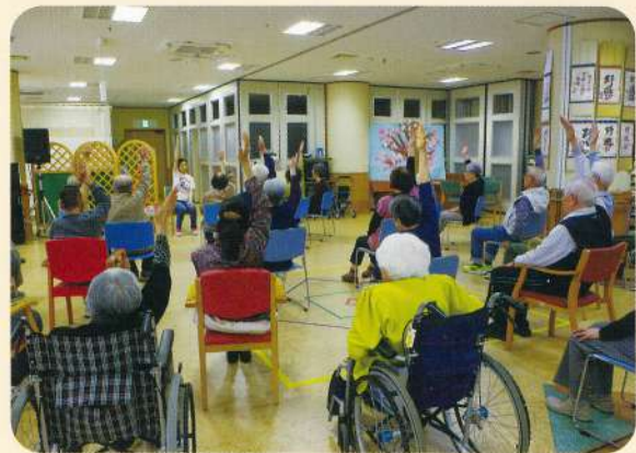
「体操」（通所介護）いつまでも元気でいられるように楽しく運動をしていただけるようお手伝いします